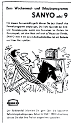
Typische Werbeillustration von Erhard Wenzel, 1967.